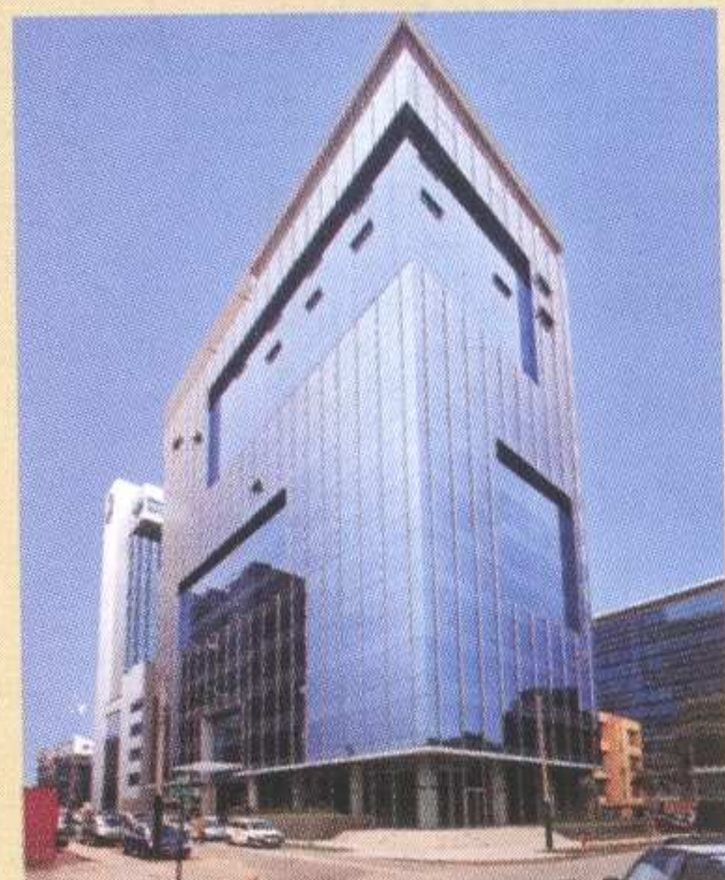
NUESTRA PORTADA Centro Empresarial Platinum Plaza.

Zeta Bookstore S.R.L. Arequipa. Av. Ejército N° 793.